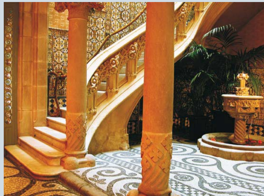
Patio and stairs in the reception / Pati i escala del vestíbul

is on the 2nd floor and comprises five rooms used for the exhibition of older and contemporary Asian art, or art done in Asia by Western artists.