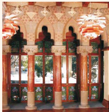
The Ispahán Room Sala Ispahán