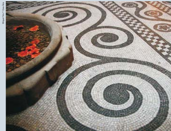
Details of mosaics and fountain in the reception Detall del mosaic i de la font del vestíbul